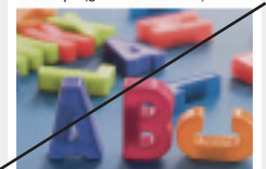
RGB-Farbmodus, zum Vergleich