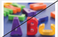
CMYK-Farbmodus 72 dpi (Bildschirmdarstellung)