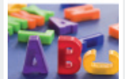
CMYK-Farbmodus 300 dpi (gedrucktes Foto)